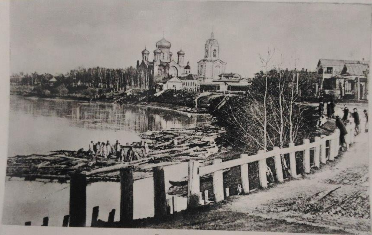
Город Глазов Фото конца XIX в.