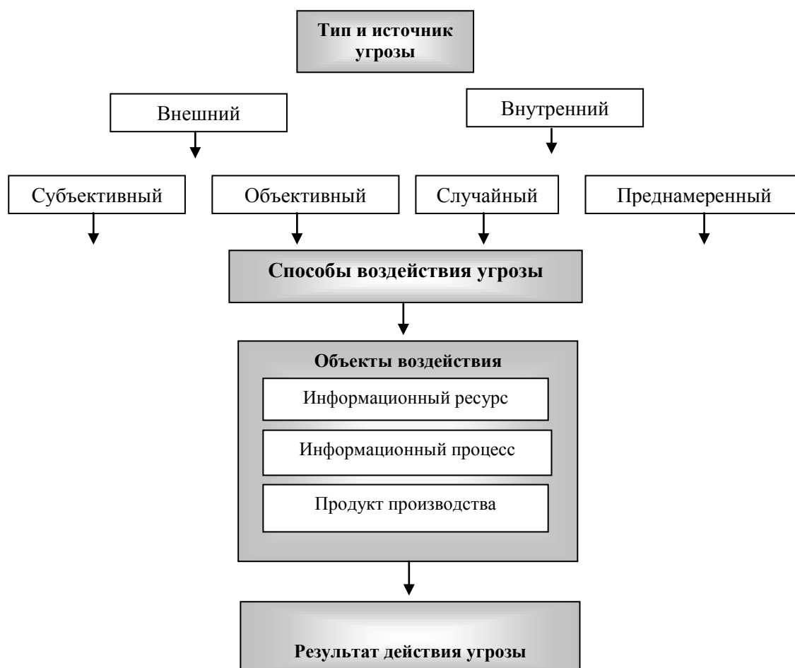
Рисунок 1. Базовая модель угроз информационной безопасности

При этом могут быть устранены или снижены угрозы информационной безопасности, защищены точки доступа угроз или минимизирован ущерб.