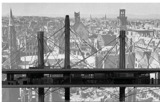
Франкфурт-на-Майне Констант Нивенхейс, «Новый Вавилон», макет, 1959