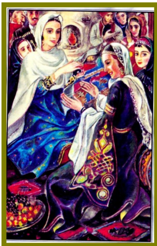
Рис. 5. Вечеринка в Чохе