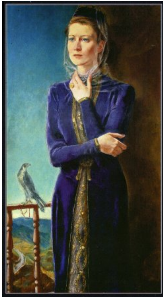
Рис. 3. Саадат (Счастье)